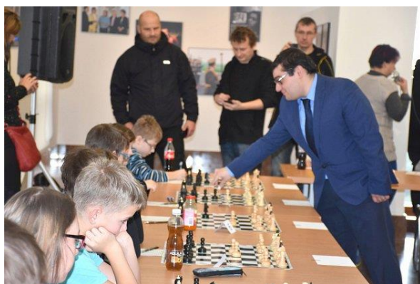
Lidická simultánka 2017

Lidice - Do Lidic se sjeli i letos šachoví velmistři, aby zde sehráli šachovou partii s mladými talentovanými nadějemi.