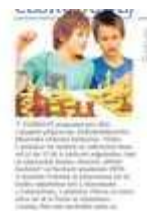
Foto popis| připravuje českobudějovická Jihočeská vědecká knihovna. Třeba v pobočce Na Sadech se uskuteční dnes od 14 do 17.30 h šachové odpoledne, kdy se zájemcům budou věnovat „dětští šachisté“ ze Šachové akademie VŠTE. V Suchém Vrbném je připraveno od 16 hodin...

rubrika: Českobudějovicko / Jižní Čechy - strana: 02