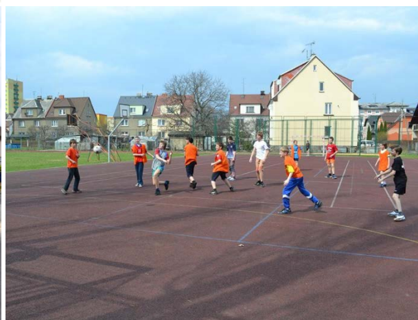
Lokalizace herního místa – Sportovní hala při ZŠ Janáčkovo nám. 17, Krnov

Jako UBYTOVÁNÍ , které lze přes nás objednat, jsme zvolili Internát (domov mládeže) při Střední škole průmyslové na adrese Opavská 49, Krnov . Ubytování je to sice skromné, ale čisté a levné. Pokoje jsou třílůžkové, při rezervaci noclehu na to, prosím, myslete. Často toto ubytování pro své akce využíváme, jeho kapacita i cena nemá v rámci Krnova konkurenci. V propozicích turnaje můžete najít i odkazy na ubytování vyššího standardu, které si můžete individuálně objednat sami.