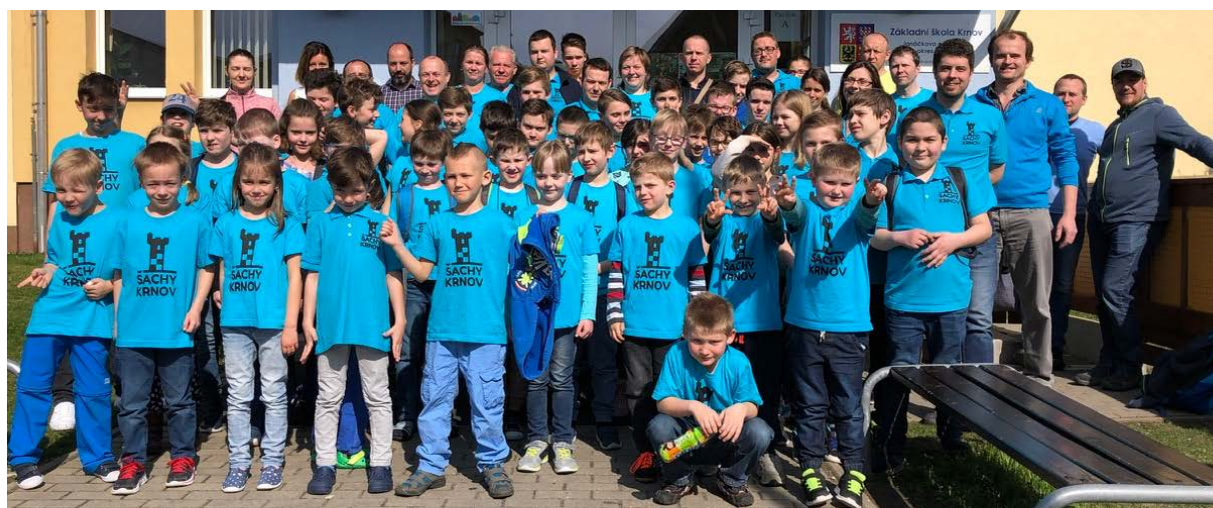
„Šmoulí rodinka“ ŠACHY KRNOV

Šachy Krnov v tomto roce slaví 10. výročí znovuzaložení mládežnického šachového oddílu, který dnes čítá na 150 dětí a mládežníků, má zázemí na 12 tréninkových místech nejen v Krnově, ale i v okolních obcích (Úvalno, Lichnov, Zátor, Brantice) a provozuje i vlastní Krajské tréninkové centrum mládeže. A jak jinak toto výročí nejlépe oslavit než s těmi nejmenšími šachisty a šachistkami na jejich letošním Mistrovství ČR!