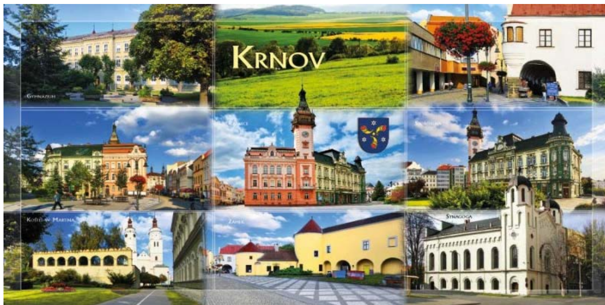
Malé foto-pozvání za krnovskými památkami

Šachy Krnov, z.s. Vás srdečně zvou k účasti na MISTROVSTVÍ ČESKÉ REPUBLIKY DĚTÍ DO 8 LET PRO ROK 2023 , které na domácí půdě - v Krnově – pořádá v termínu: 30. 4. – 1. 5. 2023.