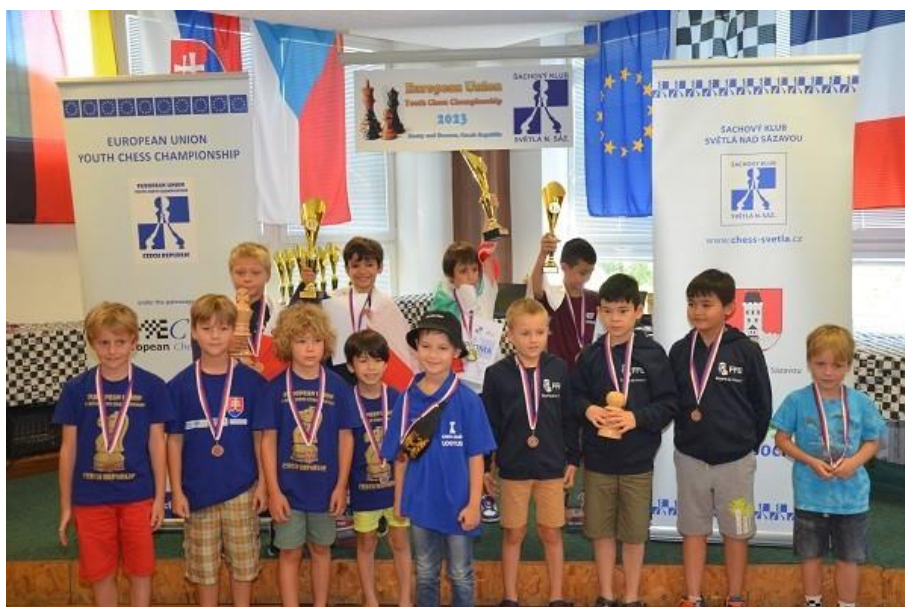
Společné foto nejmladších účastníků

Pro více informací navštivte následující odkazy: