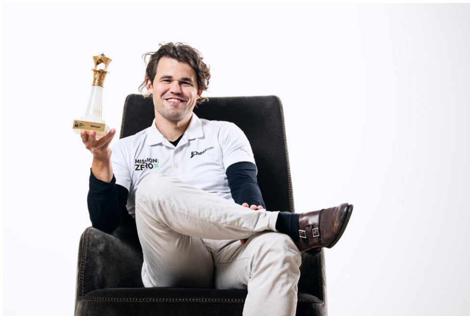
Magnus Carlsen a jeho poslední doposud chybějící trofej

V sekci Open zvítězil Magnus Carlsen. Dosáhl tak významného milníku ve své šachové kariéře. Získal svůj první titul z dějiště Světového poháru. Jednalo se o jediný turnaj, který chyběl v jeho obrovské sbírce triumfů (tzv. „Grand Slam“).