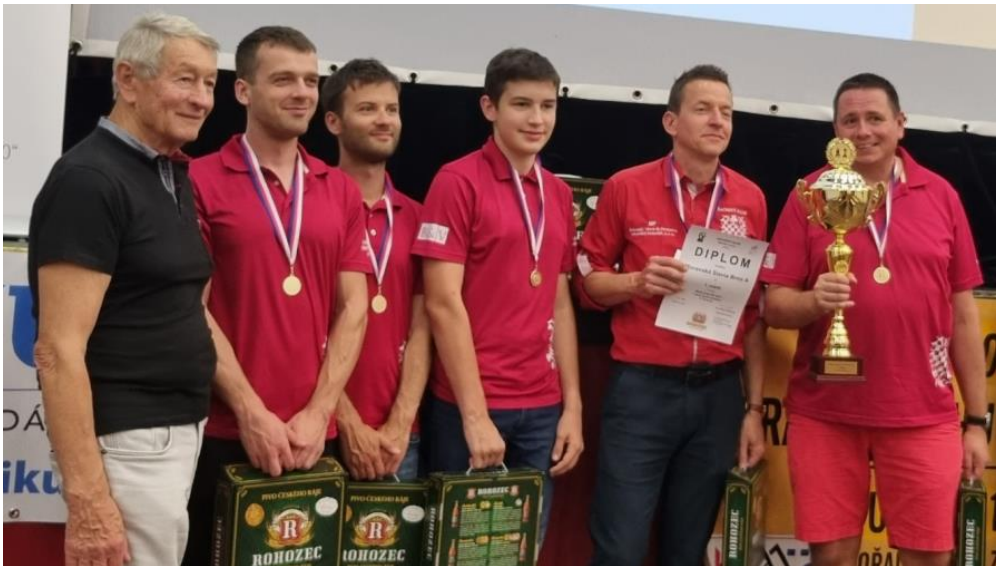
Mistry ČR pro rok 2023 v rapid šachu se stalo družstvo Moravské Slavie Brno A

Více informací naleznete v článkách z blesku a rapidu.