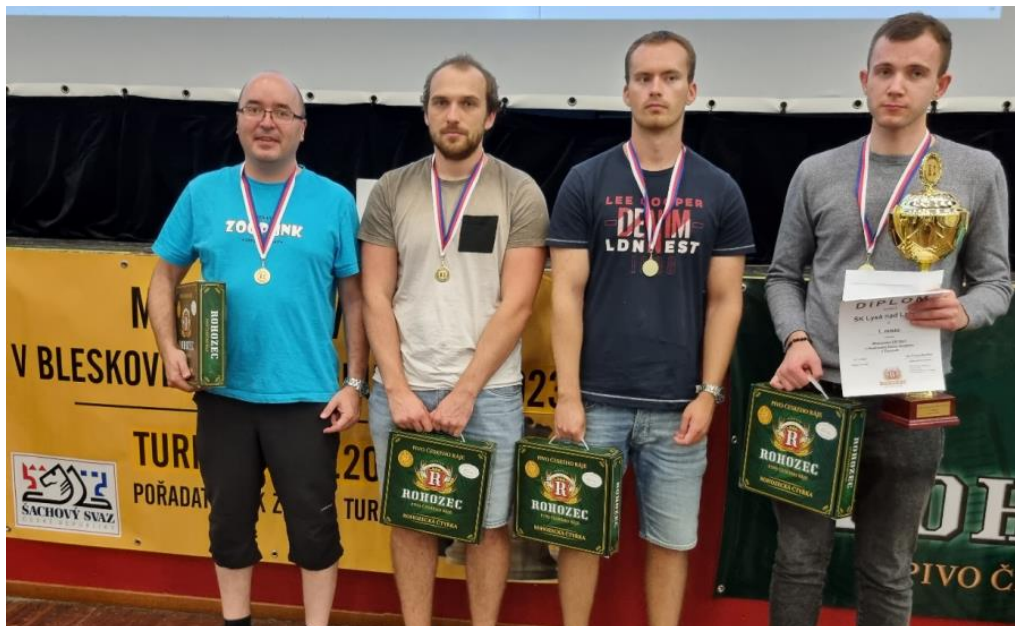
Mistry ČR pro rok 2023 v bleskovém šachu se stalo družstvo ŠK Lysá nad Labem