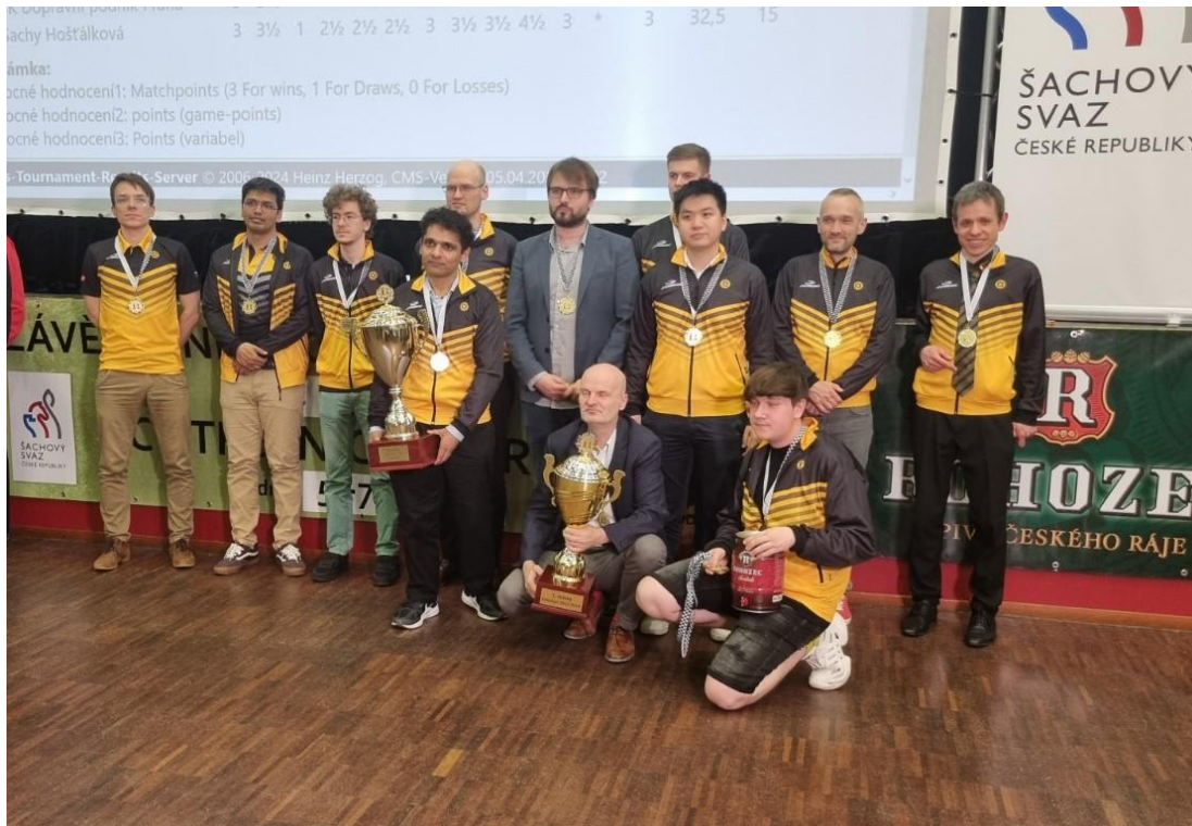
Vítěz Extraligy pro sezónu 2023/2024 - 1. Novoborský ŠK

Po napínavých bojích celkově zvítězil 1. Novoborský ŠK, který mohl již kolo před koncem soutěže slavit svůj 13. extraligový titul! Vicemistry pro letošní extraligové dění se stali hráči Moravské Slavie. Stupně vítězů doplnil další moravský celek s přízviskem Slavia, a to Slavia Kroměříž. Diváci taktéž napjatě sledovali boje na opačné straně tabulky. Poslední záchrannou pozici si skvělým výkonem v závěru vybojoval Unichess. S Extraligou se tak loučí týmy Dopravní podnik Praha a Šachy Hošťálková.