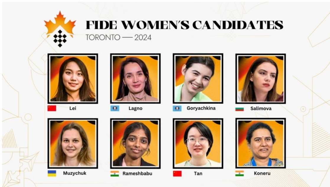
Startovní listina žen

Po sedmém kole se v mužské kategorii prozatím nejvíce daří lanu Nepomniachtchimu (4,5/7). U žen vede tabulku Tan Zhongyi (5/7).