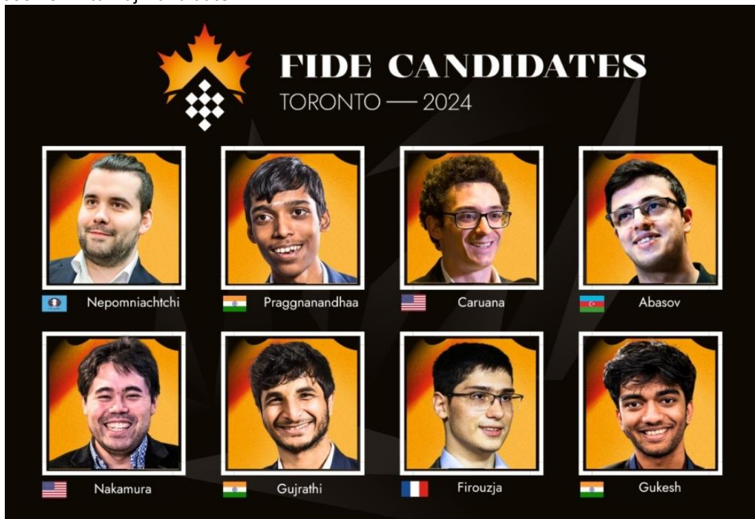
Startovní listina mužů

Turnaj kandidátů jak mužů, tak i žen pro rok 2024 se koná ve dnech 3.—23. 4. 2024 v kanadském Torontu. Je to vůbec poprvé, co se tato akce koná v Severní Americe a zároveň jsou oba turnaje organizovány společně na jednom místě. Oba turnaje jsou dvoukolové, což znamená, že každý hráč se utká se sedmi soupeři dvakrát, jednou s bílými a jednou s černými figurami. Kromě prvního místa budou hráči soutěžit také o podíl z finančních prostředků ve výši 500 000 EUR v turnaji kandidátů a 250 000 EUR v turnaji kandidátek.