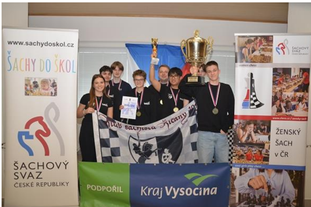
Mistr ČR: KOBEX Říčany „B“

Během prvních kol se týmu KOBEX Říčany B podařilo nasbírat nejvyšší možný počet bodů, díky čemuž odskočil svým konkurentům o 4 body a zaručil si kolo před koncem mistrovský titul.