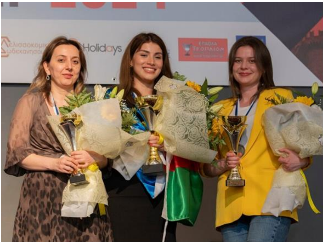
Zleva: Lela Javakhishvili, mistryně Evropy Ulviyya Fataliyeva a vicemistryně Nataliya Buksa

Celkovou vítěžkou se po dramatickém průběhu turnaje stala Ulviyya Fataliyeva, která získala celkem 8,5 bodu a na své soupeřky měla náskok celého bodu. O dalších medailových příčkách však muselo rozhodnout až pomocné hodnocení, neboť hned osm šachistek získalo shodně 7,5 bodu. Na druhém místě se nakonec umístila Nataliya Buksa a díky výhře v posledním kole se na třetí místo vyhoupla Lela Javakhishvili.