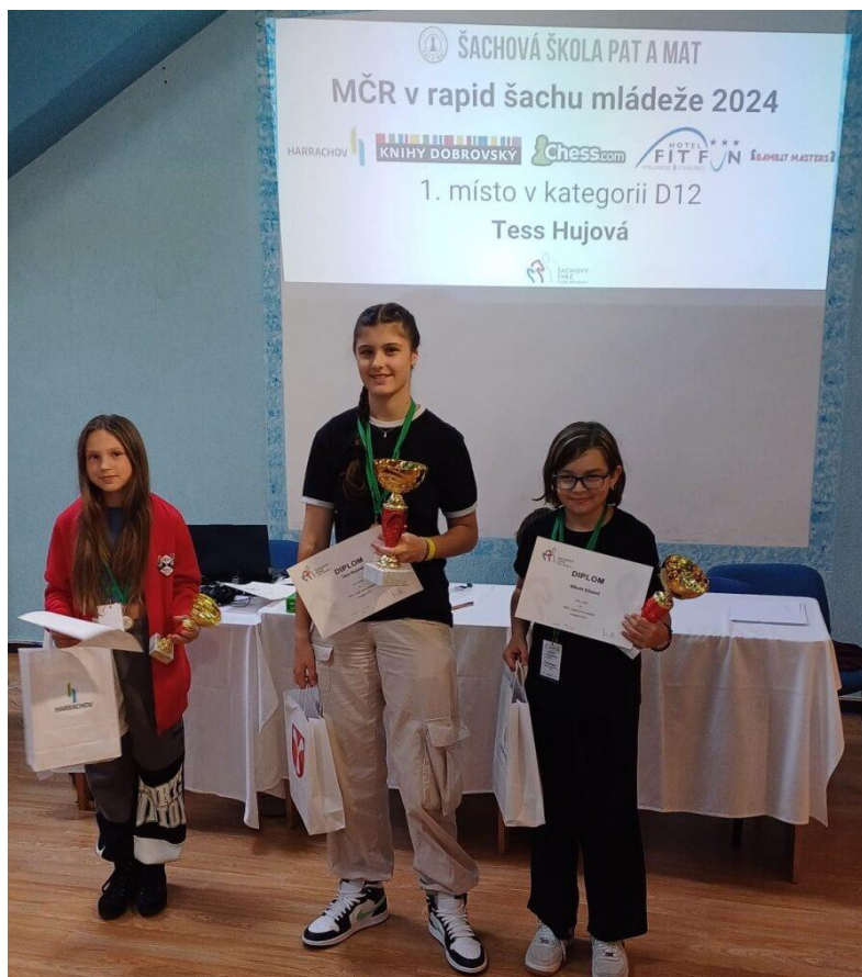
Vítězky kategorie D12