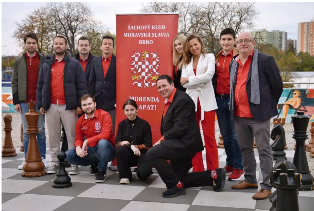
ŠK Moravská Slavia

První listopadový víkend započaly extraligové boje. Dvanáct nejlepších celků tak představilo své nabitě kádry, které se v období pauzy obměňovaly. Favorité své zápasy povětšinou vyhráli. Do nové sezóny skvěle vkročila družstva Sigil Fund Pardubice (včetně předehrávky), Šachový klub Moravská Slavia, Slavia Kroměříž, 1. Novoborský ŠK a Výstaviště Lysá nad Labem. Se 6 body tak mohou favorité spokojeně nastoupit do dalších, prosincových, bojů.