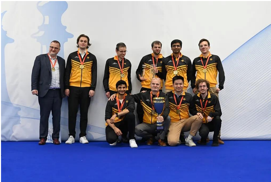
Vítězové Evropského klubového poháru

Skutečnost podtrhuje i vyjádření kapitána: „ Finální kola jsme sehráli excelentně. Oni museli, my chtěli. Uspěli jsme s oběma nejsilnějšími týmy, letošní pohár byl opravdu našlapaný. Máme velmi cenné zlato. “