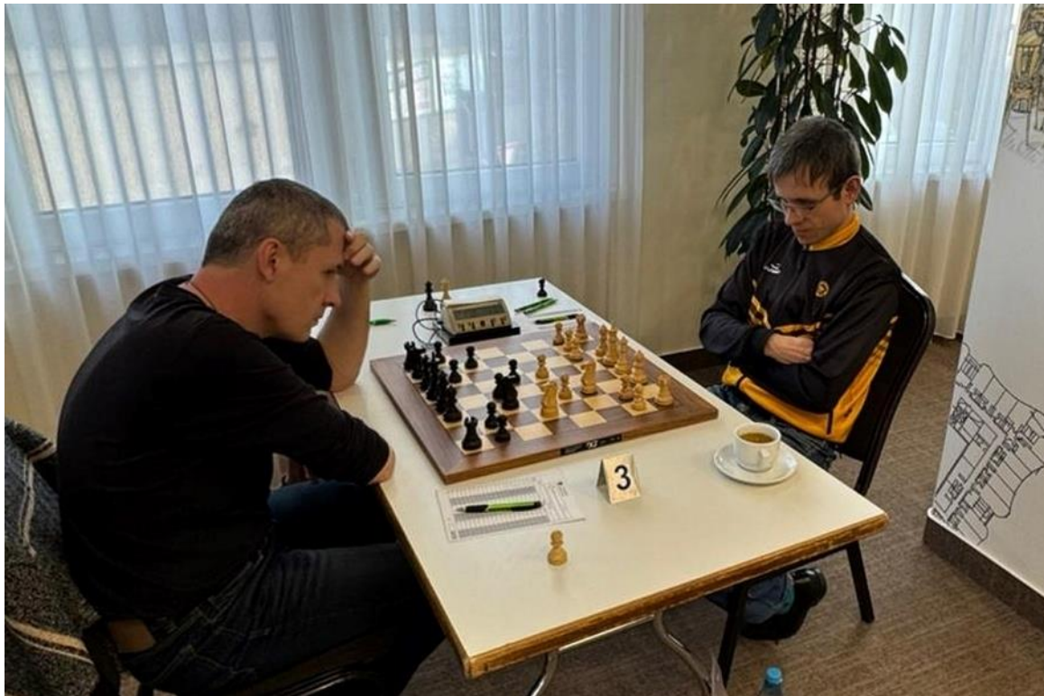
Foto ze zápasu 7. kola mezi týmy 1. Novoborský ŠK a Slavia Kroměříž

O druhém víkendu, kdy se odehrálo 7. a 8. kolo, byli fanoušci opět překvapeni. Několikanásobní šampióni z 1. Novoborského si upevnili prozatímní vedení díky dvěma výhrám. To bylo velmi důležité, protože na jejich záda stále dýchá celek z Lysé nad Labem, který taktéž zaznamenal úspěšné dvojkolo a má dokonce stejný počet bodů, jen horší pomocné hodnocení. Naopak Moravská Slavia opět nestačila na své soupeře a znovu v novém roce připsala dvě nuly. Tým se tak slabými výkony sesunul z nejvyšších příček až na 6. místo. Z posledních čtyř kol připsaly nuly i týmy jako OAZA a Líně, oproti brněnské Slavii se však budou muset v březnovém trojkolu výrazně zlepšit, neboť se nacházejí, společně s GASCO Pardubice, na sestupových příčkách.